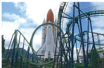
スペースワールド（閉鎖）

反省点を踏まえて、来年度向けの素晴らしいコースを作成し、より良い修学旅行を提供出来るように、引き続き社員一同頑張ってまいりたいと思います。