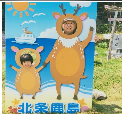
北条鹿島でハイポーズ