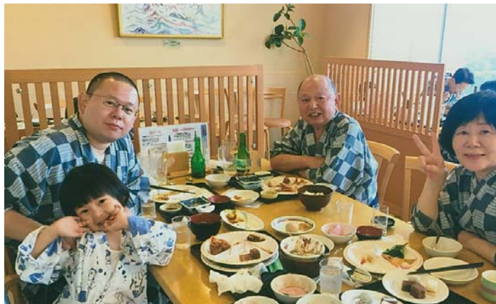
休暇村瀬戸内東予での夕食